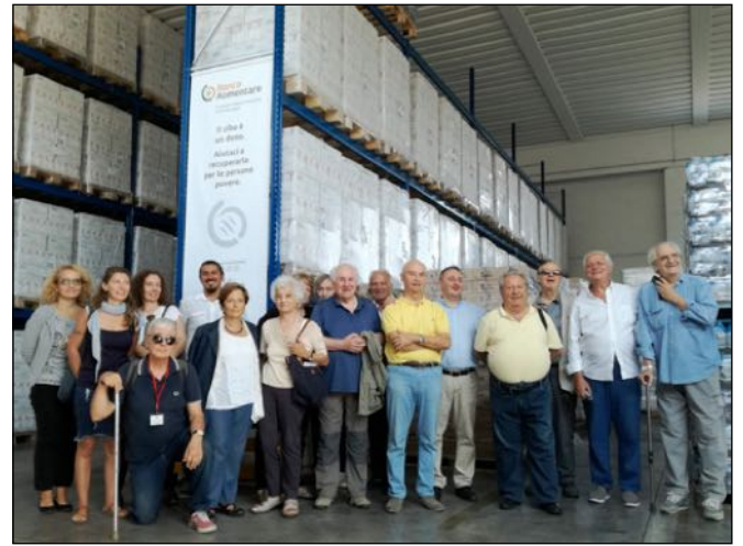
Visita dei gionalisti ARGA Emilia Romagna Imola, 21 settembre