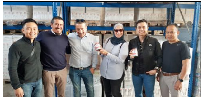
Visita della Companies Commission of Malaysia Imola, 20 ottobre