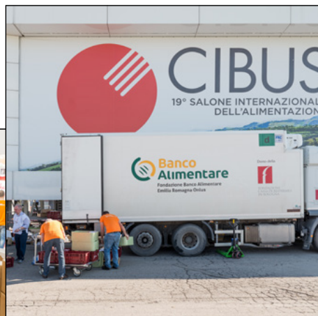
Recupero eccedenze presso CIBUS Parma, 10 maggio