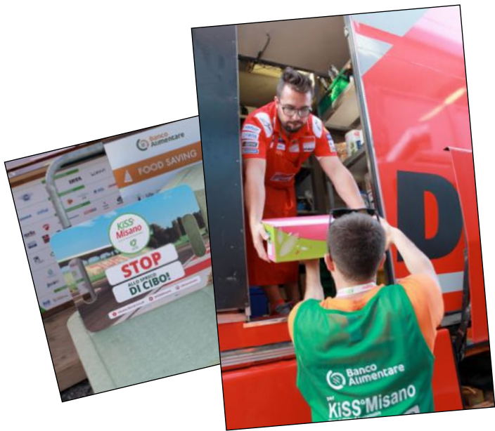
Kiss Misano, recupero al Moto GP Misano, 8/9 settembre