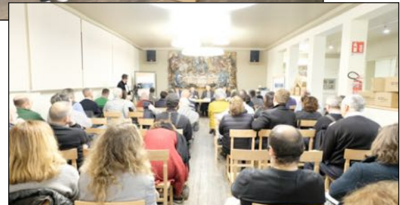
Lancio Colletta Alimentare in Emilia Romagna Bologna, 6 novembre