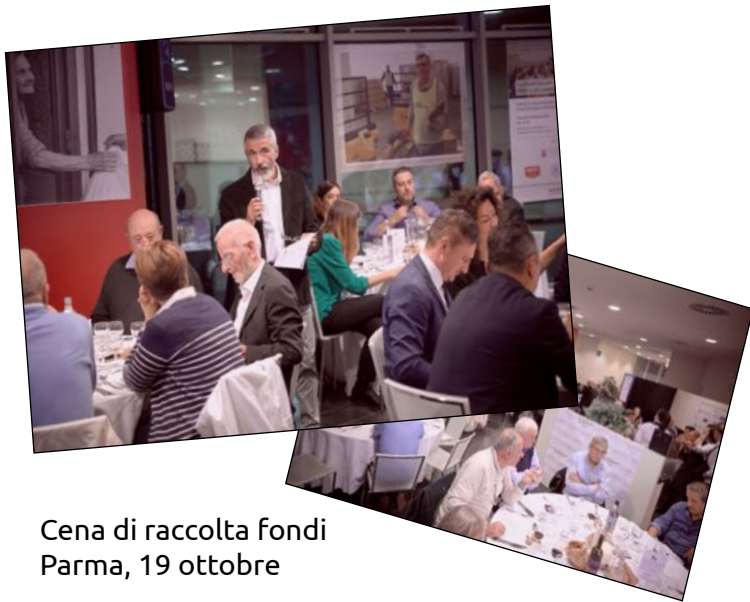
Cena di raccolta fondi Parma, 19 ottobre