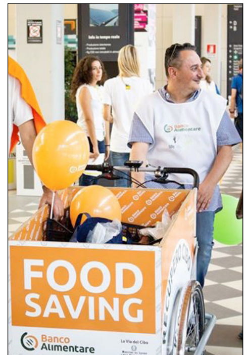
Recupero eccedenze al Meeting per l'Amicizia fra i Popoli Rimini, 19/25 agosto