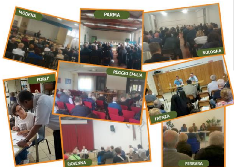
Incontri di area con le strutture caritative settembre - novembre